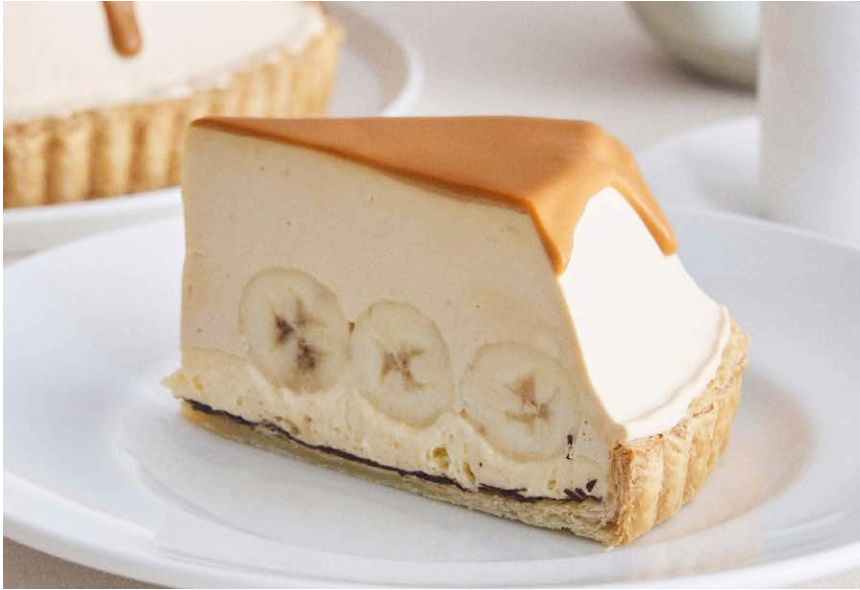
生キャラメルの バナナ塩カスタードクリームパイ Caramel banana salted custard cream pie

ひとつひとつの素材をしっかりと感じられる、シンプルでまっすぐなおいしさのデザートです。