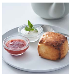
ピュアバタースコーン Pure butter scone

650 (税込 715) drink set 1,250 (税込 1,375) +ラムレーズン +50 (税込 55)