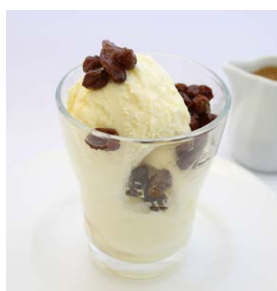
アイスクリームの エスプレッソがけ Ice cream with espresso

650 (税込 715) drink set 1,250 (税込 1,375) +ラムレーズン +50 (税込 55)