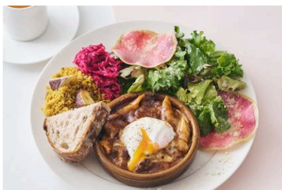
温泉たまごの ビーフシチューグラタン Beef Stew Gratin with Half-Boiled Egg