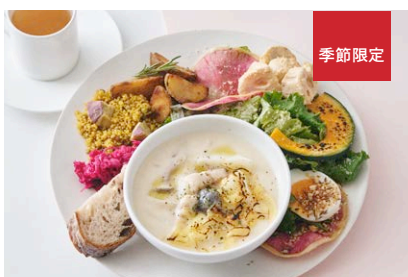
パンチェッタときのこの チーズクリームスープ& デリサラダプレート Pancetta & Mushroom Cheese Cream Soup with Deli Salad Plate