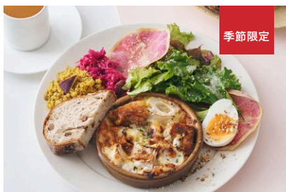
若鶏とレンコン、さといもの ホワイトジンジャーグラタン Ginger Chicken Gratin with Lotus Root & Taro