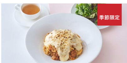
スパイシーボロネーゼ クリーミーグラタン仕立て〈サラダ付き〉 Spicy Bolognese, creamy gratin style