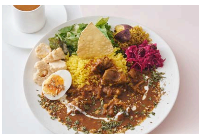
チキントマトスパイスカレーのミールズ Chicken Tomato Spice Curry Meal