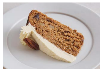
くるみとレーズンの キャロットケーキ Walnut and raisin carrot cake