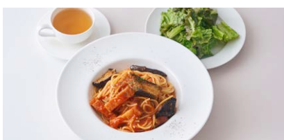
ナスとベーコンの 自家製トマトソースパスタ 〈サラダ付き〉 Tomato sauce pasta