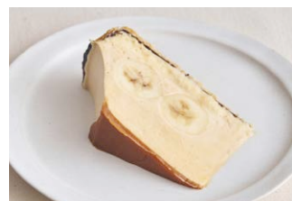
生キャラメルの バナナ塩カスタードクリームパイ Caramel banana salted custard cream pie