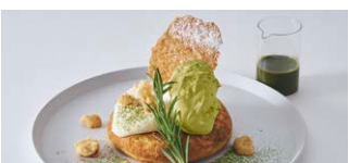
抹茶とマスカルポーネクリームの パンケーキ Matcha & Mascarpone cream pancake