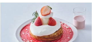
エアリーチーズクリームの “ホール”パンケーキ Airy cheese cream "whole" pancakes [+100(税込110)]