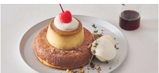
淡路島・北坂養鶏場 “さくらたまご”プリンの パンケーキ "Sakura egg" pudding pancake