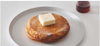
ビュアバターパンケーキ Pure butter pancake