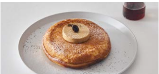
オーガニックコーヒーの エスプレッソバターパンケーキ Organic coffee espresso butter pancake