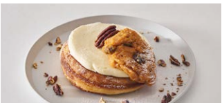
キャロットケーキパンケーキ Carrot cake pancake