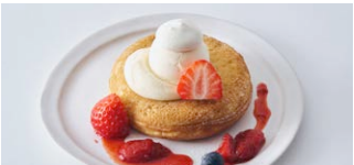
ベリーとクリームチーズの パンケーキ Berry & creamcheese pancake