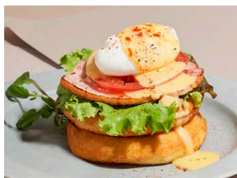
エッグベネディクト パンケーキ