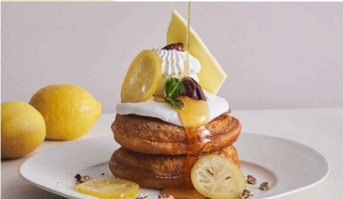
5月限定 塩バニラクリームとシュガーバターのパンケーキ レモンティーソース