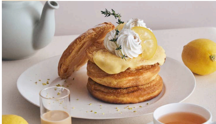
“大長レモン”のレモンパイパンケーキ ダーズリンアングリーズソース