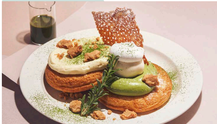
抹茶とマスカルポーネクリームの パンケーキ