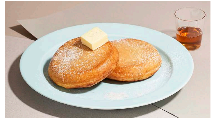
ピュアバターパンケーキ