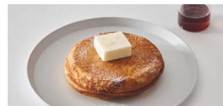
ピュアバターパンケーキ Pure Butter Pancake