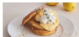
“大長レモン”のレモンパイ パンケーキ “Ocho Lemon” Lemon Pie Pancake