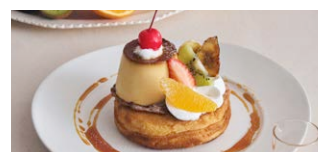
淡路島・北坂養鶏場 “さくらたまご”プリンアラモード パンケーキ Pudding à la Mode Pancake [+200(税込220)]