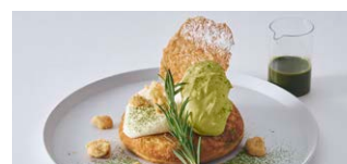
抹茶とマスカルポーネクリームの パンケーキ Matcha & Mascarpone Cream Pancake