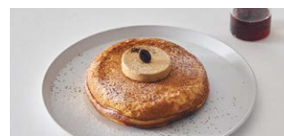
オーガニックコーヒーの エスプレッソバターパンケーキ Organic Coffee Espresso Butter Pancake