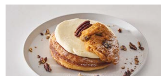
キャロットケーキパンケーキ Carrot Cake Pancake