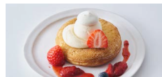
ベリーとクリームチーズの パンケーキ Berry & Cream Cheese Pancake