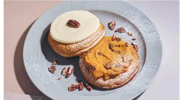
キャロットケーキパンケーキ クリームチーズフロスティング