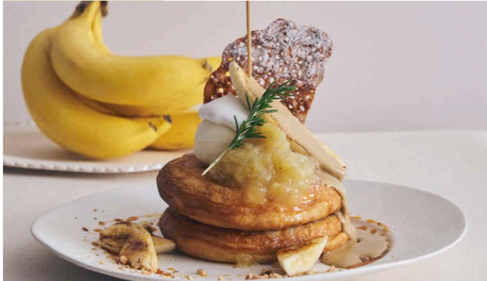
4月限定 キャラメルバナナとバナナコンフィチュールのパンケーキ ほうじ茶カスタードソース