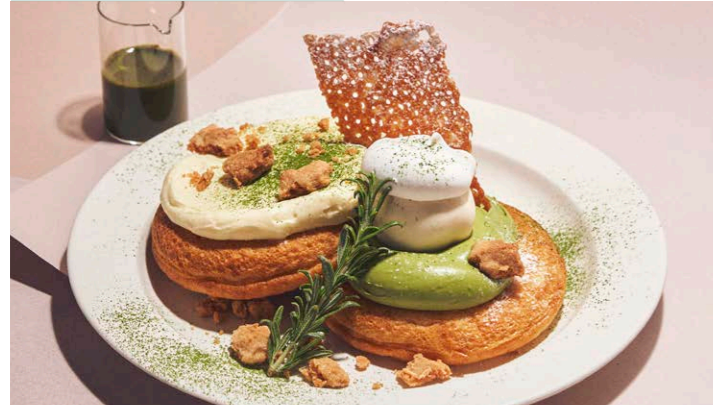
抹茶とマスカルポーネクリーム のパンケーキ