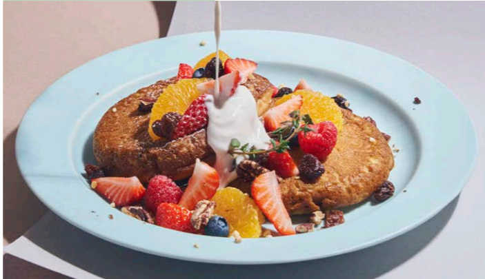
フルーツとナッツの グルテンフリーパンケーキ