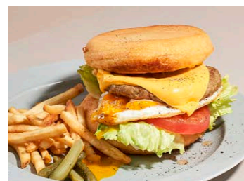
パンケーキバーガー