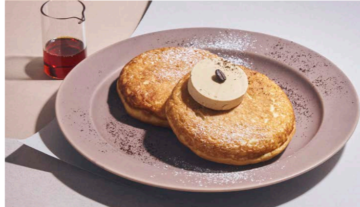
オーガニックコーヒーのエスプレッソバターパンケーキ キャラメルソース