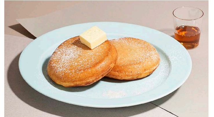
ピュアバターパンケーキ