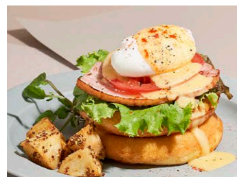
エッグベネディクト パンケーキ