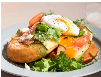
サーモンとリコッタチーズの パンケーキ