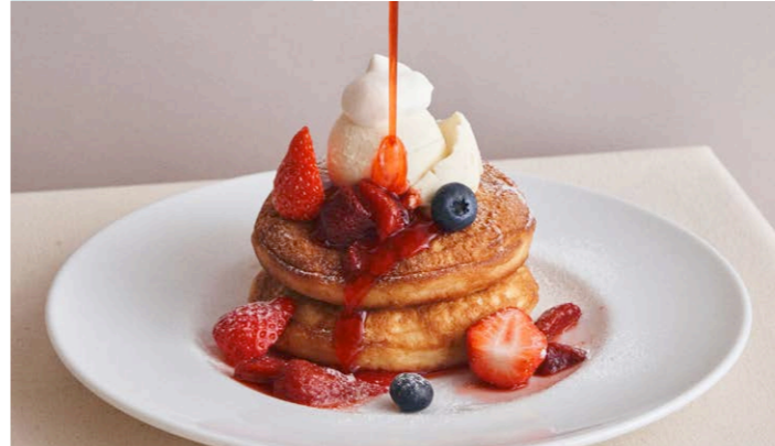
ベリーとクリームチーズの パンケーキ