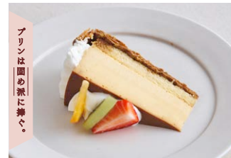
プリンアラモードパイ Pudding a la mode pie