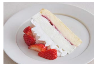
“朝摘み完熟紅ほっぺ”いちごの ベイクド&レア<生>チーズケーキ 'Bani Hoppe' strawberry baked & rare cheesecake