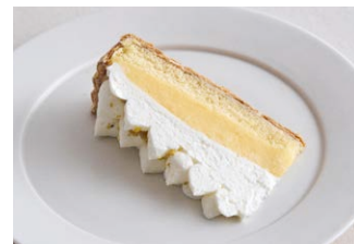
“大長レモン”のレモンパイ Lemon pie from Ocho Lemons