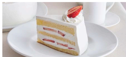
“朝摘み完熟紅ほっぺ”いちごの クラシカルショートケーキ