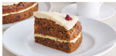
くるみとレーズンの キャロットケーキ