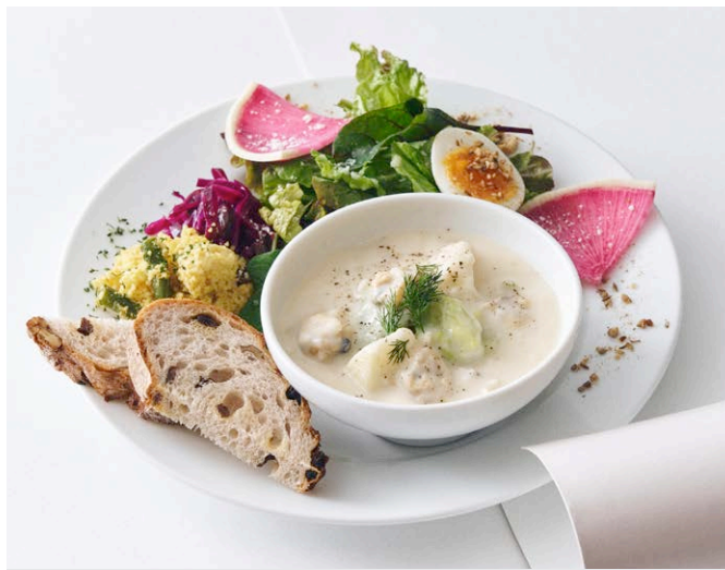
あさりと春キャベツのクラムチャウダー& 有機オニオンドレッシングのサラダ