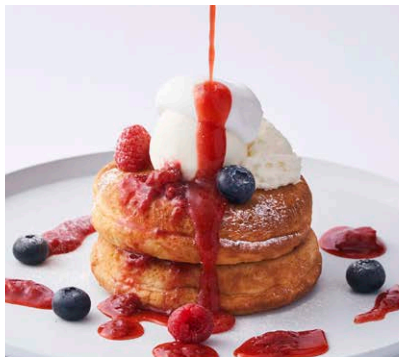
ベリーとクリームチーズの パンケーキ