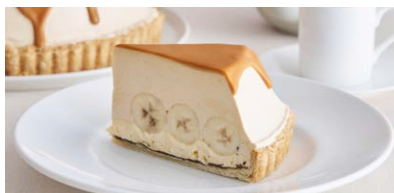
生キャラメル バナナ塩カスタード クリームパイ