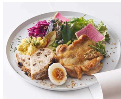
華味鳥(はなみどり)使用 ローズマリー チキンのソテー マスタードソース