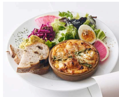
海老と春かぶ、アスパラの トマトクリームグラタン