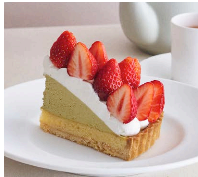
“朝摘み完熟紅ほっぺ” いちごと 濃厚ピスタチオの リッチタルト