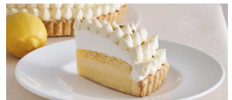
“ おおちょう 広島県産大長レモン”の レモンパイ