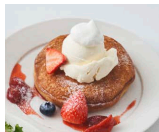
ベリーとクリームチーズの 1段パンケーキ Berry & creamcheese pancake