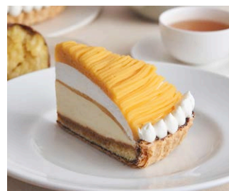
“蜜芋”づくしのモンブランパイ Sweet potato Mont Blanc pie