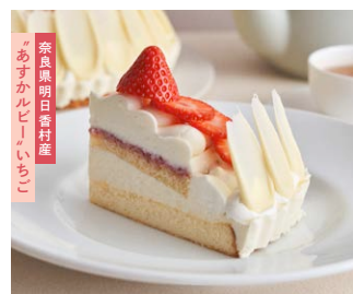
“あすカルビー”いちごの ベイクド&レア<生>チーズケーキ Asuka Ruby’ strawberry baked & rare cheesecake