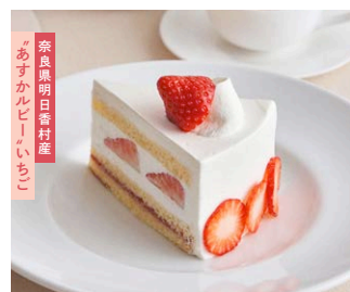
“あすカルビー”いちごの ふんわり<生>ショートケーキ ‘Asuka Ruby’ strawberry shortcake