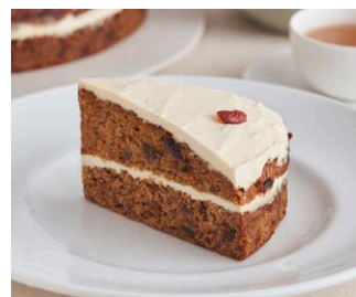
くるみとレーズンの キャロットケーキ Walnut and raisin carrot cake